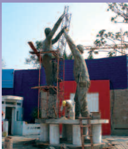
Vista parcial de la construcción del stand

El notable crecimiento de FANCESA , duplicará de un año a otro nuestra capacidad de producción de cemento, ése será el tema principal del stand de la empresa en la EXPOCRUZ 2007 , a realizarse en el mes de septiembre del presente año.