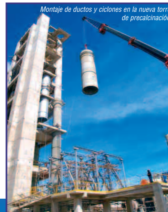
Montaje de ductos y ciclones en la nueva torre de precalcinación

Se debe resaltar el gran esfuerzo y compromiso de todo el personal de la empresa, especialmente del equipo asignado a este importante proyecto, que se ha trazado la meta de concluir el proyecto en los plazos definidos.