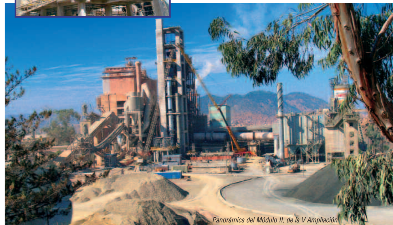
Panorámica del Módulo II, de la V Ampliación

Este gran emprendimiento más otros realizados en molienda y despacho de cemento, consolidará a FANCESA como la empresa líder de la industria cementera nacional.